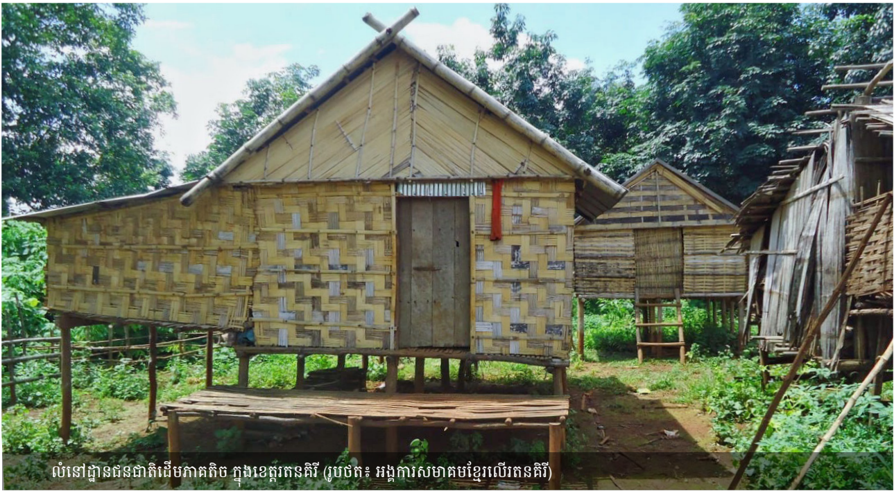
លំនៅដ្ឋានជនជាតិដើមភាគតិច ក្នុងខេត្តរតនគិរី