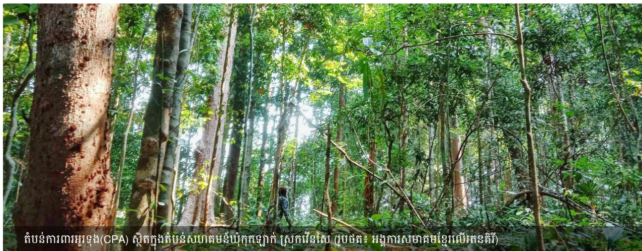
តំបន់ការពារអូរឡុង (CPA) ស្ថិតក្នុងតំបន់សហគមន៍ឃុំកុកឡាក់ ស្រុករើនសៃ (រូបថត៖ អង្គការសមាគមខ្មែរលើកនគីរី)

ជំពូកទី ៥ នៃសៀវភៅណែនាំនេះណែនាំអំពីធាតុផ្សំសំខាន់ៗនៃសិទ្ធិកាន់កាប់ជាលក្ខណៈប្រពៃណីដែលអាចចងក្រងជាឯកសារបាន។ ធាតុទាំងនេះរួមមាន ព័ត៌មានមូលដ្ឋាននៃភូមិ ប្រវត្តិនៅមូលដ្ឋាន ការប្រើប្រាស់ដីធ្លី និងការគ្រប់គ្រងដីធ្លី ការកាន់កាប់ និងការផ្ទេរធនធាន ស្ថាប័ន ការដោះស្រាយជម្លោះជីវភាពរស់នៅ និងទិដ្ឋភាពវប្បធម៌នៃដីធ្លី។ ធាតុផ្សំនីមួយៗទាំងនេះត្រូវបានពន្យល់ជាមួយនឹងសំណួរស្រាវជ្រាវដែលបានស្នើសម្រាប់អ្នកសម្របសម្រួល និងវិធីសាស្ត្រដែលបានស្នើឡើង។ ជំពូកនេះក៏ពណ៌នាអំពីឧបករណ៍សំខាន់ៗក្នុងការប្រើប្រាស់និងនីតិវិធីដែលត្រូវអនុវត្តតាម នៅពេលចងក្រងឯកសារធាតុផ្សំនីមួយៗនៃសិទ្ធិកាន់កាប់ជាលក្ខណៈប្រពៃណី រួមទាំងការធ្វើផែនទី ការពិភាក្សាជាក្រុម ការសំភាសន៍ផ្សេងៗ និងការសង្កេតនៅមូលដ្ឋាន។