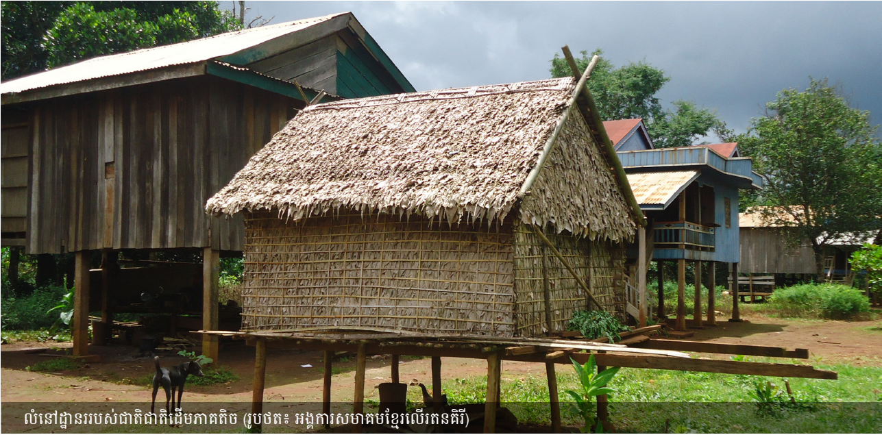
លំនៅដ្ឋានរបស់ជាតិជាតិដើមភាគតិច

វាមានប្រយោជន៍ក្នុងការលើកនិយាយអំពីវិធានសម្រាប់ការផ្ទេរសិទ្ធិ និងការទទួលបានសិទ្ធិ។ ប្រភេទផ្សេងគ្នានៃ “កម្មសិទ្ធិ” ជារឿយៗមានវិធានផ្សេងៗគ្នាសម្រាប់របៀបដែលដីអាចផ្លាស់ប្តូរម្ចាស់។ តើវិធានផ្ទៃក្នុងអំពីមរតកមានអ្វីខ្លះ? តើវាខុសគ្នាសម្រាប់បុរសនិងស្ត្រីទេ? តើវិធានផ្ទៃក្នុងសម្រាប់លក់ដីមានអ្វីខ្លះ? តើវិធានផ្ទៃក្នុងខុសគ្នាសម្រាប់ប្រភេទដី និងធនធានខុសគ្នាឬ? នេះគ្របដណ្តប់ទាំងការផ្ទេរអចិន្ត្រៃយ៍ដូចជា មរតក (និងរង្វាន់ “អាពាហ៍ពិពាហ៍”) ការលក់អំណោយ ឬការផ្ទេរបណ្តោះអាសន្ន ដូចជាការជួល/ការចែករំលែក ឬការឱ្យខ្ចីដោយឥតគិតថ្លៃ។