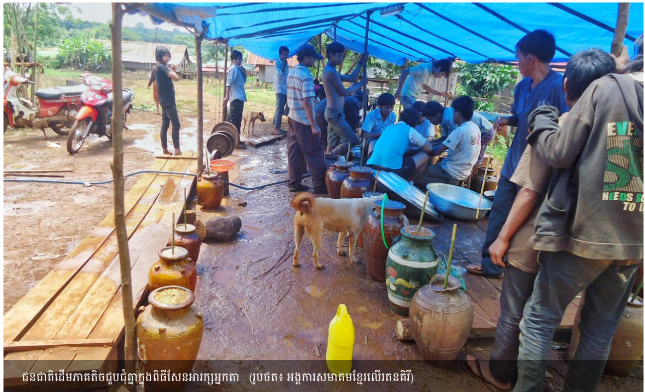
ជនជាតិដើមភាគតិចជួបជុំគ្នាក្នុងពិធីសែនអារក្សអ្នកតា (រូបថត៖ អង្គការសមាគមខ្មែរលើរតនគិរី)

សម្រាប់អ្នកចូលរួមប្រភេទផ្សេងៗគ្នា ដែលអាចរួមចំណែកដល់ការគូររូប និងការពិភាក្សាអំពីផែនទី ទោះបីជាអ្នកចូលរួមខ្លះមិនចេះអក្សរក៏ដោយ។ ទោះជាយ៉ាងណាក៏ដោយ ការសម្ភាសន៍ជាក្រុម និងការធ្វើផែនទីសកម្មគឺអាស្រ័យលើអ្នកសម្របសម្រួលយុវជន និងបុគ្គលិកជាអ្នកខងក្រុងឯកសារដែលយល់ច្បាស់អំពីឧបករណ៍ និងប្រធានបទដែលកំពុងពិភាក្សា។ សមត្ថភាពរបស់ពួកគេក្នុងការធ្វើលំហាត់ភាសាជនជាតិដើមរបស់អ្នកចូលរួមក៏មានប្រយោជន៍ផងដែរ។ មេរៀនចុងក្រោយដែលបានរៀនគឺថា ការជូនដំណឹងជាមុនដល់អាជ្ញាធរមូលដ្ឋានអំពីគោលបំណង និងវិធីសាស្ត្រនៃឯកសារ បានបង្កើតទំនាក់ទំនង និងកិច្ចសហប្រតិបត្តិការល្អពីអាជ្ញាធរមូលដ្ឋាន និងសហគមន៍គោលដៅ។ អាជ្ញាធរភូមិ និងឃុំបានផ្តល់កិច្ចសហការយ៉ាងកក់ក្តៅ និងលើកទឹកចិត្តសហគមន៍ឱ្យចូលរួមក្នុងឯកសារ។