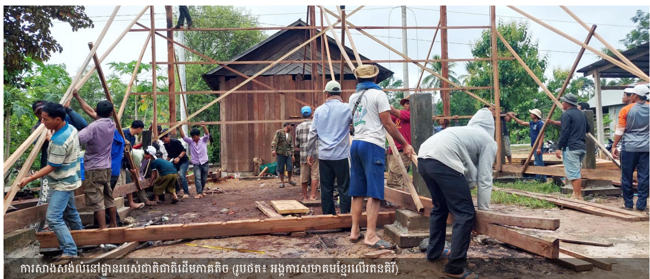
ការសាងសង់លំនៅដ្ឋានរបស់ជាតិជាតិដើមភាគតិច

សិទ្ធិកាន់កាប់ និងផ្ទេរធនធាន៖ សិទ្ធិរបស់បុគ្គល គ្រួសារ ឬសហគមន៍លើដីធ្លី និងធនធានធម្មជាតិកំណត់ការកាន់កាប់ធនធានរបស់ពួកគេ។ ការកាន់កាប់ធនធានត្រូវបានកំណត់ថាជាមធ្យោបាយទាំងអស់ដែលមនុស្សទទួលបានសិទ្ធិទទួលបានធនធានធម្មជាតិស្របច្បាប់។ សិទ្ធិកាន់កាប់គឺជាបណ្តុំនៃសិទ្ធិ(រួមទាំងសិទ្ធិក្នុងការចេញចូលប្រើប្រាស់ ការដកហូត ការគ្រប់គ្រងការបដិសេធ និងការចាត់ចែង) ប៉ុន្តែក៏រួមបញ្ចូលកាតព្វកិច្ចមិនប្រើប្រាស់ធនធានក្នុងវិធីដែលបង្កគ្រោះថ្នាក់ដល់អ្នកដទៃផងដែរ។ ការផ្ទេរ សំដៅលើមធ្យោបាយដែលសិទ្ធិរបស់បុគ្គល ឬក្រុមលើដីធ្លី និងធនធានអាចត្រូវបានផ្ទេរទៅឱ្យបុគ្គល ឬក្រុមផ្សេងទៀត។ នេះគ្របដណ្តប់ទាំងការផ្ទេរអចិន្ត្រៃយ៍ដូចជាមរតក (រួមទាំងរង្វាន់ “អាពាហ៍ពិពាហ៍”) ការលក់ ឬការបរិច្ចាគ និងការផ្ទេរបណ្តោះអាសន្នដូចជា ការជួល/ការចែករំលែកឬការខ្ចីដោយឥតគិតថ្លៃ។ ឥទ្ធិពលលោកខាងលិចជារឿយៗ នាំទៅដល់ការយល់ដឹងថា សិទ្ធិកាន់កាប់គឺជាកម្មសិទ្ធិ និងទ្រព្យសម្បត្តិ។ ទោះជាយ៉ាងណាក៏ដោយគោលគំនិតទាំងនេះគឺខុសគ្នា ហើយវាជារឿងសំខាន់ក្នុងការចាប់យកវាក្នុងអំឡុងពេលរៀបចំឯកសារ ដើម្បីឱ្យសហគមន៍យល់កាន់តែច្បាស់អំពីសិទ្ធិដែលពួកគេចង់ទទួលបានការទទួលស្គាល់។