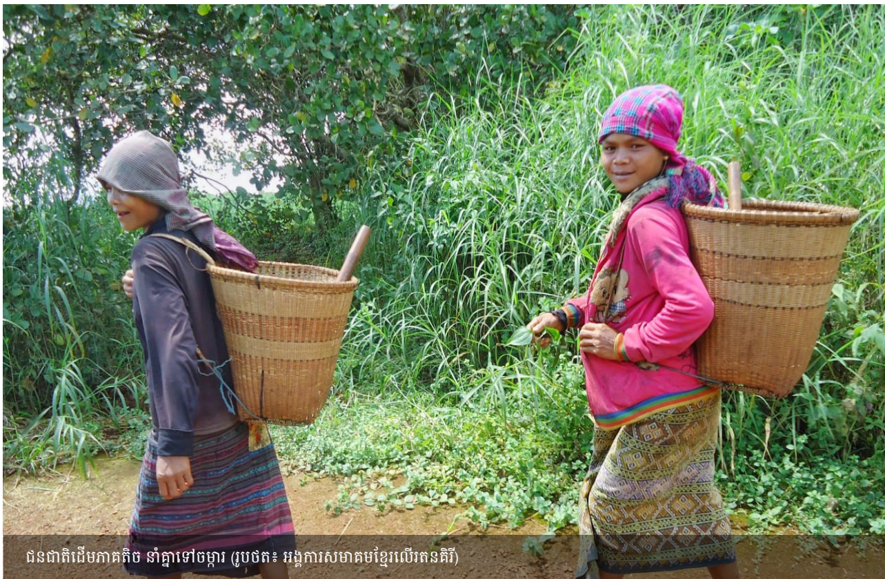
ជនជាតិដើមភាគតិច នាំគ្នាទៅចម្ការ