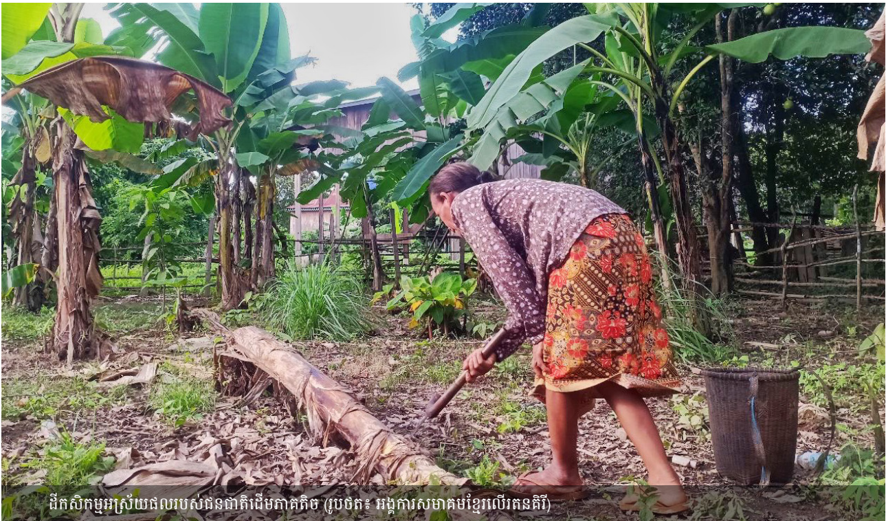
ដីកសិកម្មស្រូវយធីលរបស់ជនជាតិដើមភាគតិច

ប្រតិទិនតាមរដូវអាចបង្ហាញពីជំហានសម្រាប់ការគ្រប់គ្រងព្រៃឈើក្នុងរយៈពេលមួយឆ្នាំ ឬសម្រាប់ចំការពនេចរក្នុងរយៈពេលច្រើនឆ្នាំ។ ប្រសិនបើគោលបំណងរបស់អ្នកគឺដើម្បីពង្រឹង ការគ្រប់គ្រងដីធ្លីសហគមន៍ និងធនធាន ឬប្រមូលភស្តុតាងមូលដ្ឋាន ដើម្បីតស៊ូមតិសម្រាប់ការទទួលស្គាល់ជាផ្លូវការកាន់តែច្រើននៃ សិទ្ធិកាន់កាប់ជាលក្ខណៈប្រពៃណី សូមចំណាយពេលកត់ត្រាវិធានផ្ទៃក្នុងគ្រប់គ្រងធនធានទាំងនេះ ប្រសិនបើពួកគេមិនមាន។ សូមប្រាកដថា មនុស្សផ្សេងគ្នាជាច្រើននៅក្នុងសហគមន៍មានឱកាសពិភាក្សា និងធ្វើការផ្លាស់ប្តូរចំពោះ សេចក្តីព្រាងវិធានផ្ទៃក្នុងនេះ។ សហគមន៍អាចសម្រេចចិត្តបង្កើតវិធានផ្ទៃក្នុងថ្មី ឬប្រភេទប្រើប្រាស់ដីថ្មី (ឧ. តំបន់ព្រៃអភិរក្ស ឬតំបន់ហាមឃាត់ការបរបាញ់)។ ក្នុងករណីនេះសួរសំណួរលម្អិតអំពីអ្វីដែលមាន និងមិនត្រូវបានអនុញ្ញាតនៅក្នុងព្រៃដើម្បីបង្កើតការពិភាក្សាអំពីជម្រើស។