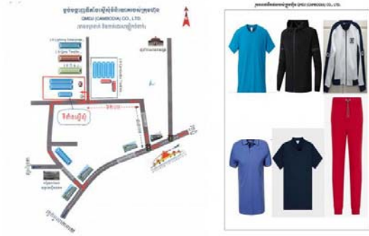
រោងចក្រ គម្រោងវិនិយោគ

ក្រុមហ៊ុន QMDJ (CAMBODIA) CO., LTD មានទីតាំងវិនិយោគស្ថិតនៅភូមិ ក្បាលដំបូល សង្កាត់កាបទី១ ខណ្ឌពោធិ៍សែនជ័យ រាជធានីភ្នំពេញ និង រាល់បង្កើតការងារបានចំនួន ៨៨៧នាក់។