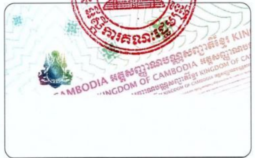
ផ្ទៃកខាងក្រោយ ពសឡាមីណែត