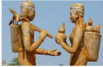
តេនៈគីរី