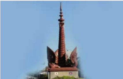
កំពង់ចាម