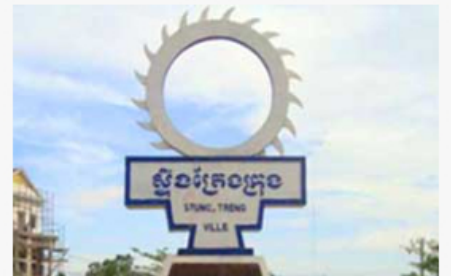
ស្ទឹងត្រែង