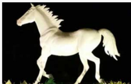
បន្ទាយមានជ័យ