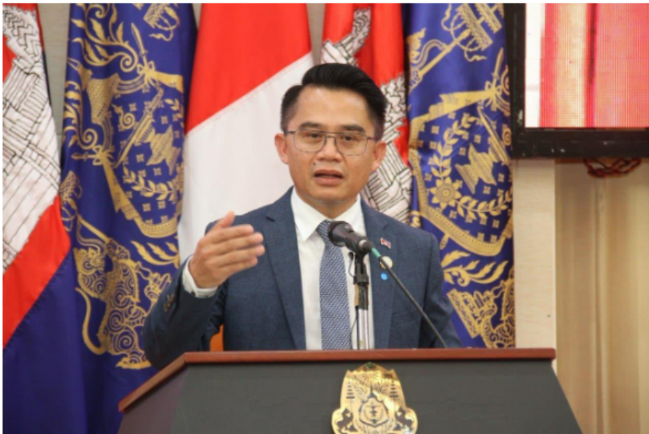
© ថ្ងៃសុក្រ, 2 ខែកញ្ញា, 2022 អត្ថបទដោយ SREY MOCH

កម្ពុជានឹងចាប់ផ្តើមអាជីវកម្មចម្រាញ់វីរុសនៅទីតាំងថ្មីមួយទៀត ក្នុងស្រុកសណ្តាន់ ខេត្តកំពង់ធំ នៅចុងឆ្នាំ២០២៣ខាងមុខនេះ ក្រោយក្រុមប្រឹក្សាអភិវឌ្ឍន៍កម្ពុជា (CDC) បានសម្រេចចុះបញ្ជីគម្រោងវិនិយោគវីរុស ជូនដល់ក្រុមហ៊ុន LATE CHENG MINING DEVELOPMENT CO., LTD។