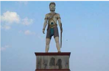
ក្រុងឃុំ

វិមាន 7មករា អាសយដ្ឋាន លេខ 203 មហាវិថីព្រះនរោត្តម ភូមិ 13 សង្កាត់ ទន្លេបាសាក់ ខណ្ឌ ចំការមន រាជធានីភ្នំពេញ ទូរសារ : ០២៣ ២១៥៨០១