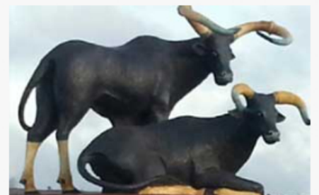
បាត់ដំបង