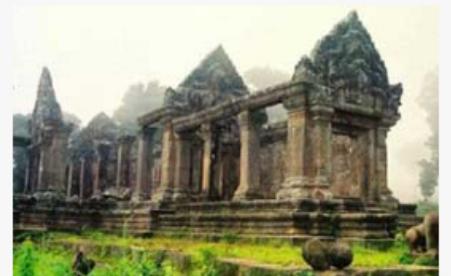
ព្រះវិហារ