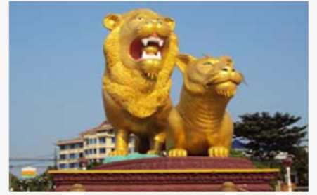
ព្រះសីហនុ