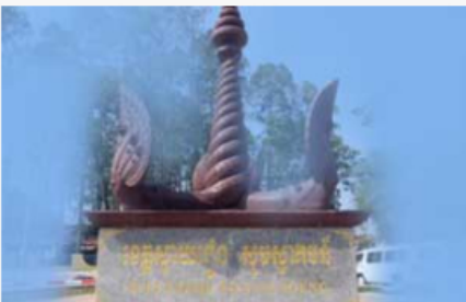
ស្វាយរៀង