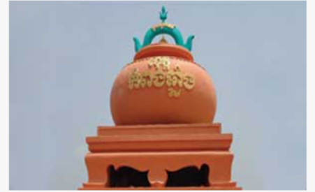
កំពង់ឆ្នាំង