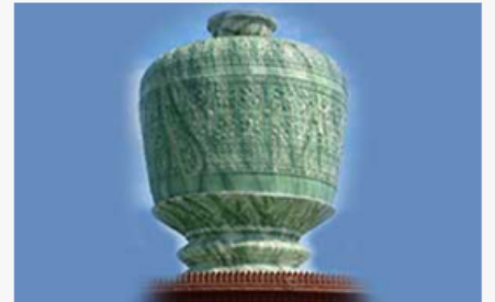
ពោធិ៍សាត់