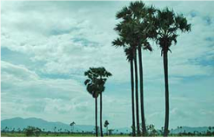
កំពង់ស្ពឺ