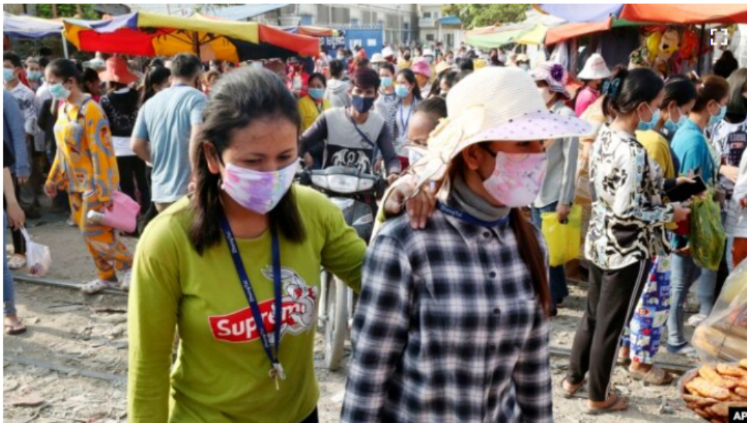
រូបឯកសារ៖ កម្មកររោងចក្រពាក់ម៉ាស់ការពារកុំឲ្យឆ្លងវីរុសកូរ៉ូណា ខណៈដែលពួកគេដើរចេញពីរោងចក្រដែល ពួកគេធ្វើការ ភ្នំពេញ ថ្ងៃសុក្រ ទី២០ ខែមិថុនា ឆ្នាំ២០២០។