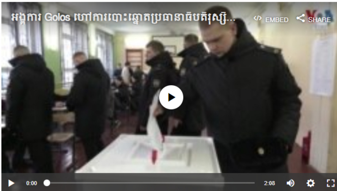
អង្គការ Golos ហៅការបោះឆ្នោតប្រធានាធិបតីរុស្ស៊ីថាជា «ការធ្វើគ្រាប់»