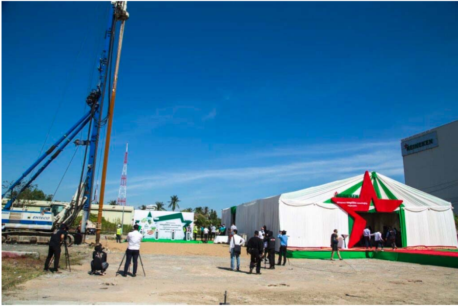
ក្រៅពីអព្យាក្រឹតភាពកាបូន ក្រុមហ៊ុន ហ៊ិននីតែន ក៏កំពុងកាត់បន្ថយការប្រើប្រាស់ទឹក

ក្នុងភាពជាដៃគូជិតស្និទ្ធជាមួយក្រុមហ៊ុនផ្គត់ផ្គង់នានា ក្រុមហ៊ុន ហ៊ិននីតែន មានបំណងកាត់បន្ថយការបញ្ចេញកាបូនឱ្យបាន ៣០%នៅត្រឹមឆ្នាំ២០៣០ នៅទូទាំងសង្វាក់ផលិតកម្មទាំងមូល (Value chain) របស់ខ្លួន ធៀបនឹងឆ្នាំ២០១៨។ នៅឆ្នាំ ២០៤០ ក្រុមហ៊ុនមានបំណងសម្រេចឱ្យបានអព្យាក្រឹតភាពកាបូននៅក្នុងសង្វាក់ផលិតកម្មទាំងមូលរបស់ខ្លួន។ ក្រុមហ៊ុនកំពុងចាត់វិធានការផ្នែកលើវិទ្យាសាស្ត្រតាមរយៈការធ្វើការងារយ៉ាងជិតស្និទ្ធជាមួយគំនិតផ្តួចផ្តើមទិសដៅ ផ្នែកលើវិទ្យាសាស្ត្រ (Science Based Targets) ដើម្បីបញ្ជាក់ពីការប្តេជ្ញាចិត្តថ្មីៗរបស់ក្រុមហ៊ុន។