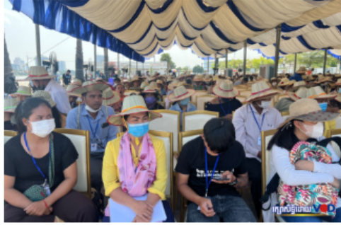
សហគមន៍ចម្រុះវិស័យទាមទារឱ្យរដ្ឋាភិបាលដោះស្រាយ វិបត្តិដីធ្លី នយោបាយ សិទ្ធិមនុស្ស និងការងារ ៣ វិច្ឆិកា ២០២២ ម៉ោង ២១:៣១