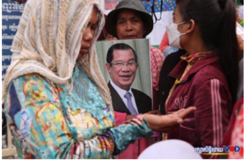
វិវាទការងារនៅរោងចក្រចំនួន៤ មិនទាន់ដោះស្រាយចប់ ខណៈកម្មករដាក់បណ្តឹងទៅក្រសួងការងារជាច្រើនខែ ១៦ ធ្នូ ២០២២ ម៉ោង ១១:៤៨