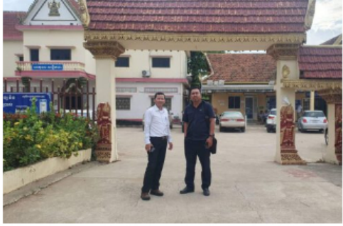
អាជ្ញាធរមូលដ្ឋាននៅក្រុងប៉ោយប៉ែត ហាមសមាគមមួយ ដែលធ្វើការផ្នែកសិទ្ធិការងារមិនឱ្យលើកស្ទួយ ២៤ វិច្ឆិកា ២០២២ ម៉ោង ១៦:២៨