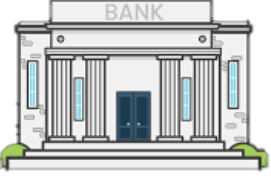
សាខាធនាគារដែលបានចុះអនុស្សរណៈ